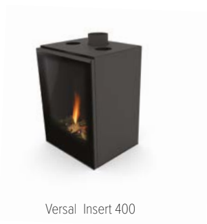
Versal Insert 400