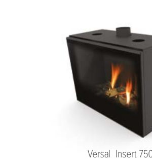
Versal Insert 750