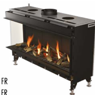
Valentino 1000 LF / FR Valentino 1300 LF / FR