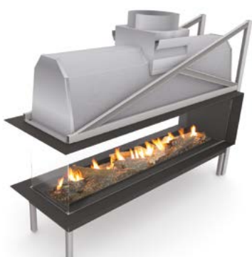
Sinatra 1200 RD Sinatra 1600 RD Sinatra 2000 RD Sinatra 2400 RD