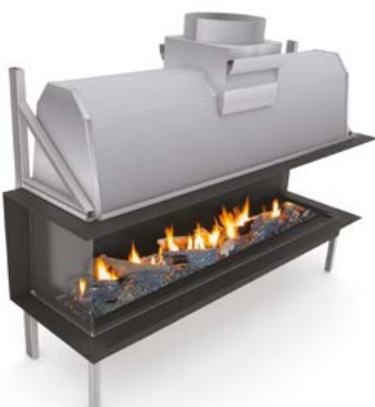
Sinatra 1600 LFR Sinatra 2000 LFR Sinatra 2400 LFR