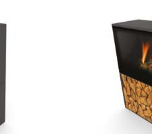
Versal Woodbox 900