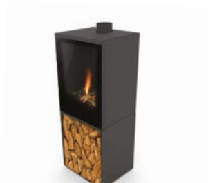
Versal Woodbox 400