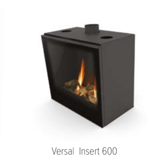
Versal Insert 600