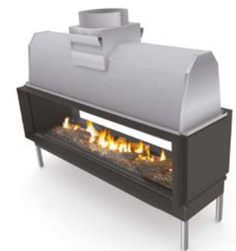
Sinatra 1200 TU Sinatra 1600 TU Sinatra 2000 TU Sinatra 2400 TU