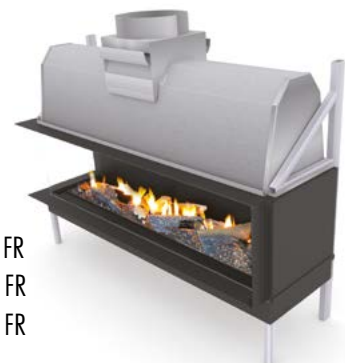
Sinatra 1600 LF / FR Sinatra 2000 LF / FR Sinatra 2400 LF / FR