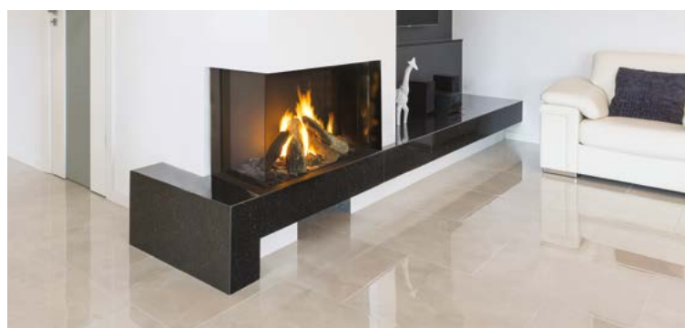
Monroe 900 LF / FR