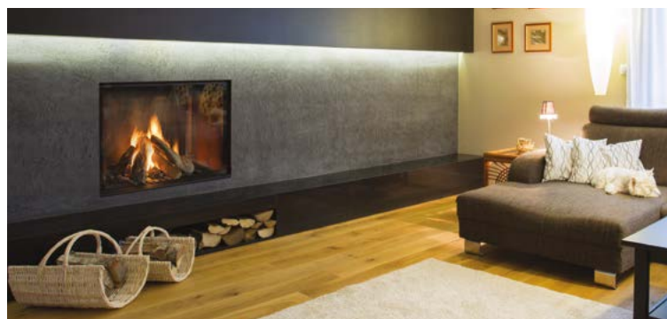
Monroe 900 F