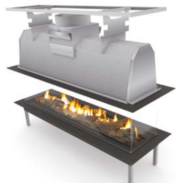
Sinatra 1200 IS Sinatra 1600 IS Sinatra 2000 IS Sinatra 2400 IS