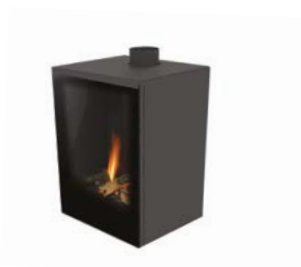
Versal Freestanding 400