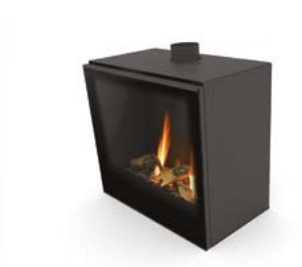
Versal Freestanding 600