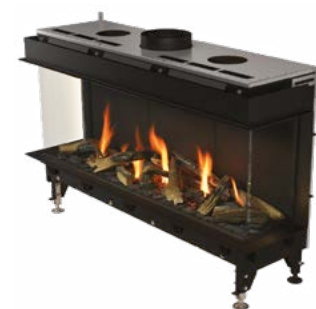
Valentino 1300 LFR