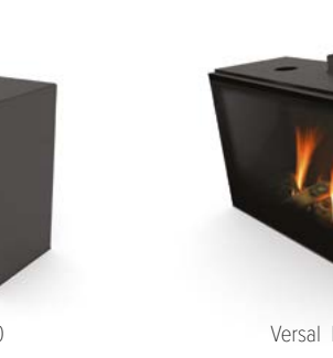
Versal Insert 900