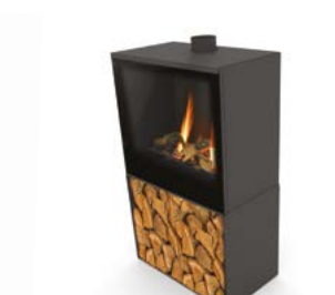
Versal Woodbox 600