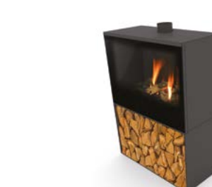
Versal Woodbox 750