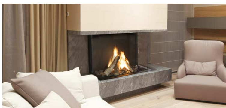
Monroe 900 LFR