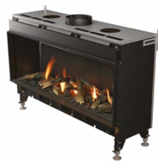
Valentino 1000 F Valentino 1300 F