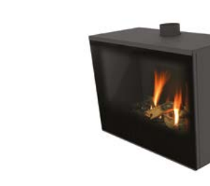
Versal Freestanding 750