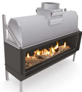
Sinatra 1600 F Sinatra 2000 F Sinatra 2400 F