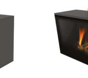
Versal Freestanding 900